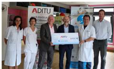
Remise de chèque par l'entreprise Aditu